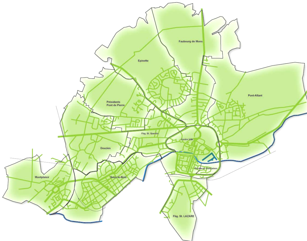
Les 11 faubourgs de Maubeuge

Néanmoins, comme l'a mis en évidence un sondage téléphonique mené récemment par l'équipe du réseau transfrontalier Beauregard , la formation de l'image de la cité participe également de l'attachement des habitants à un certain nombre d'espaces publics et de bâtiments maubeugeois qui forment le socle de l'identité communautaire.