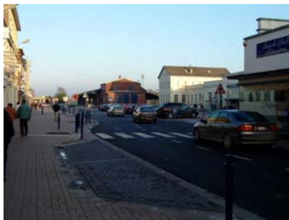
Élargissement des trottoirs du côté commerces. Changement de revêtement pour les parkings en voirie. Aménagement de chicanes en entrée et sortie de la place de la Gare pour ralentir le trafic.