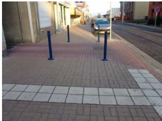
Trottoirs : accès personnes à mobilité réduite, marquage malvoyant, changement de couleur de revêtement pour les accès carrossables.