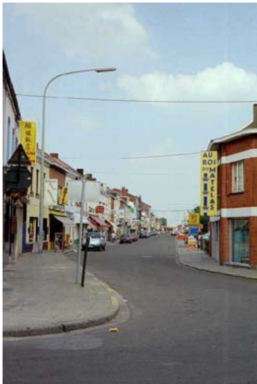
rue Albert I er , depuis la rue Saint-Antoine