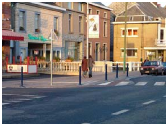
Élargissement des trottoirs au carrefour et placement de potelets anti-stationnement.