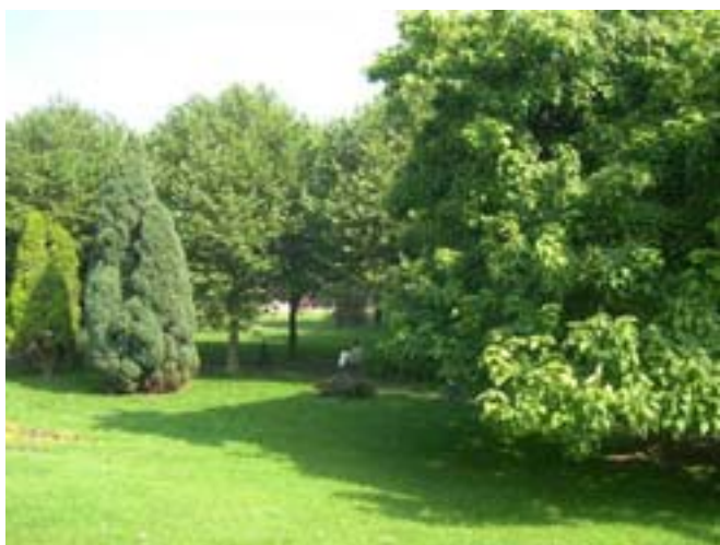
Le jardin en 2004