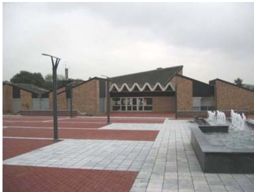
Le parvis de la salle en 2007

BEAUrEGaRD –Action 6 - Evaluation des aménagements d'espace public - 2007