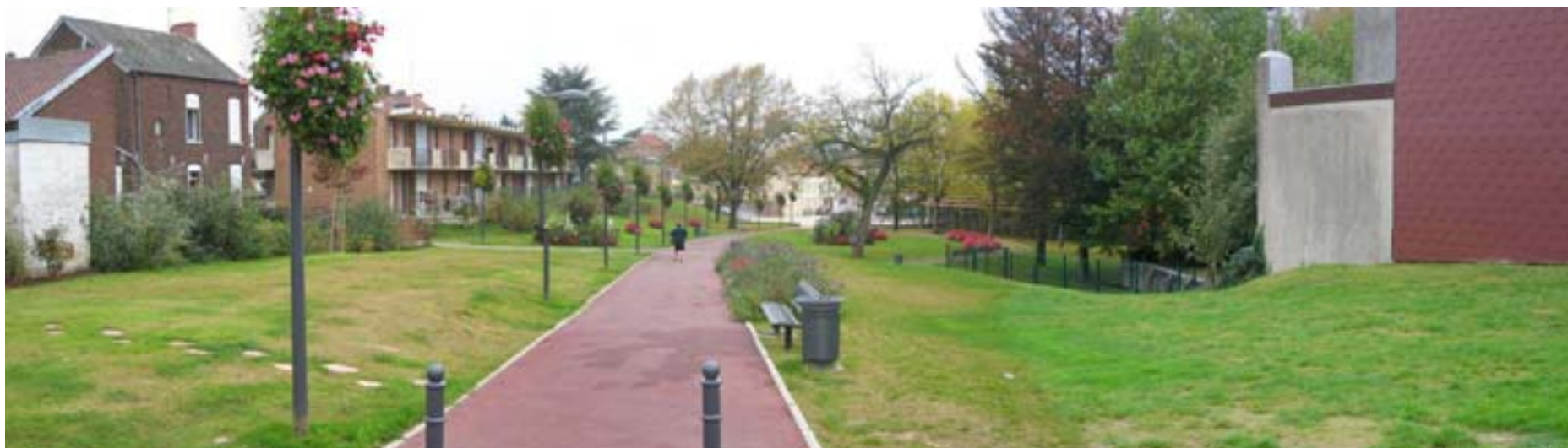
Vue depuis la RN2 (entrée du Jardin) en 2007

BEAUREGARD – Action 6 - Evaluation des aménagements d'espace public - 2007