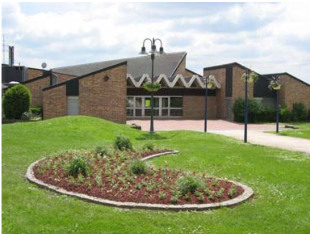
Le parvis de la salle avant travaux en 2006