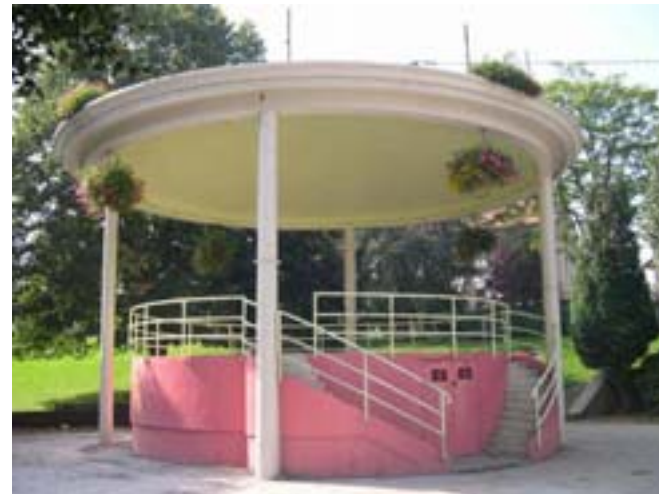
Le kiosque de style moderne en 2004