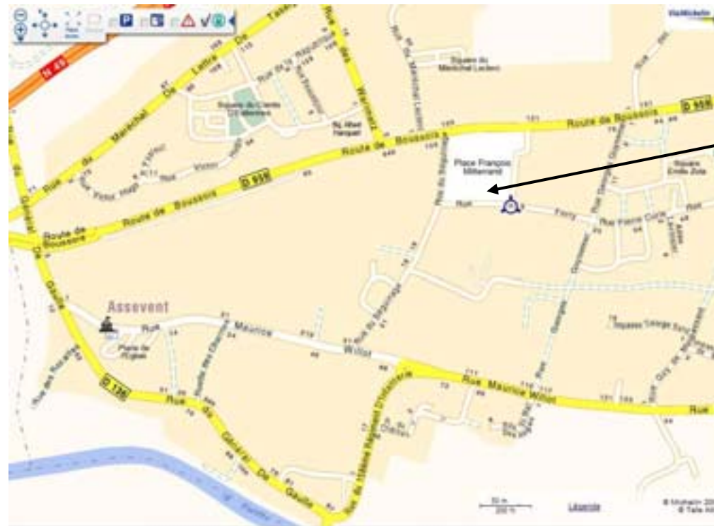
Carte de localisation

Le projet a été engagé dans le cadre d'une procédure FDAN (Fonds Départemental pour l'Aménagement du Nord).