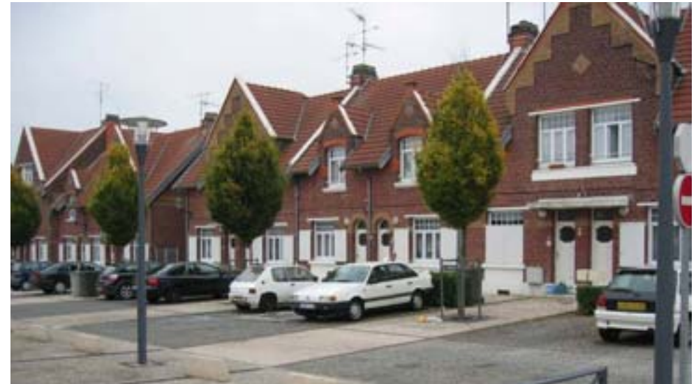
Vue de 2007. Charmes fastigiés