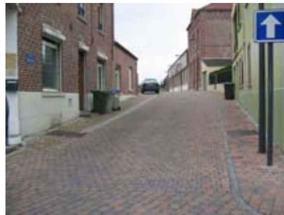
La rue Marie Curie en 2007