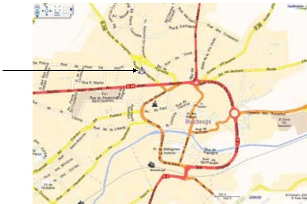
Carte de localisation

La réfection de l'espace a été conduite par la Ville de Maubeuge dans le cadre de la politique ANRU (Agence Nationale pour la Rénovation Urbaine).