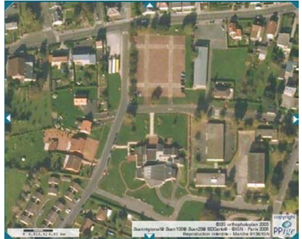
Photographie aérienne de la place (zoom) avant le projet