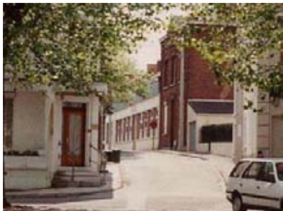
La rue Marie Curie en 1991