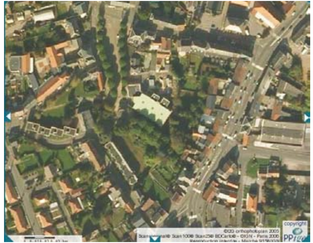
Photographie aérienne (zoom) avant travaux