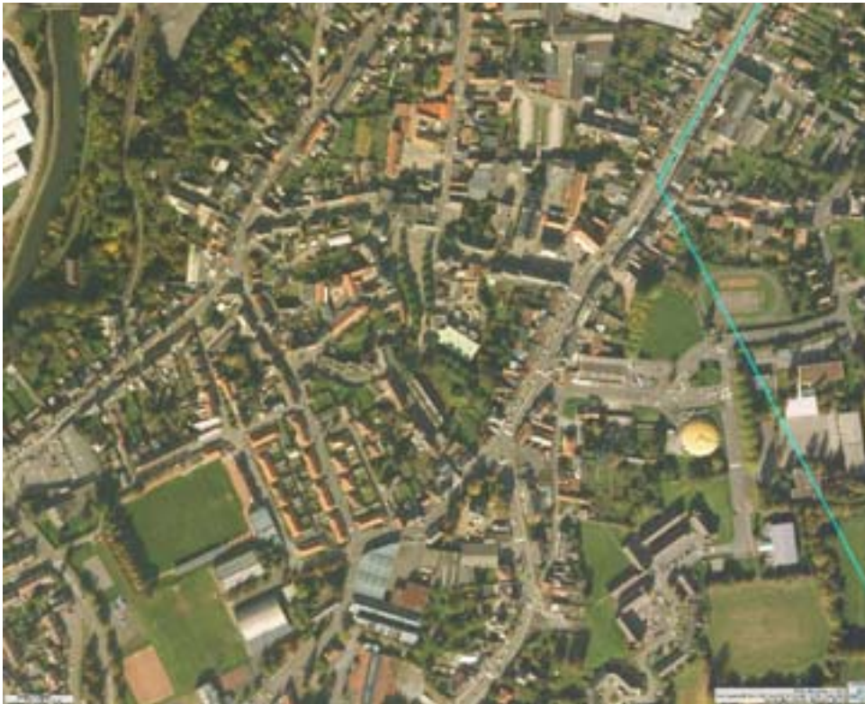
Photographie aérienne d'ensemble avant travaux