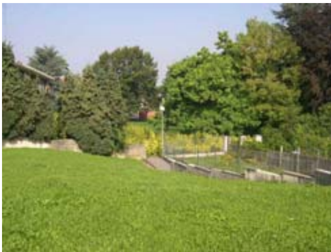
Vue depuis la RN2 avant travaux en 2004