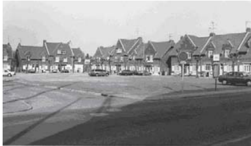
La place avant travaux en 2002