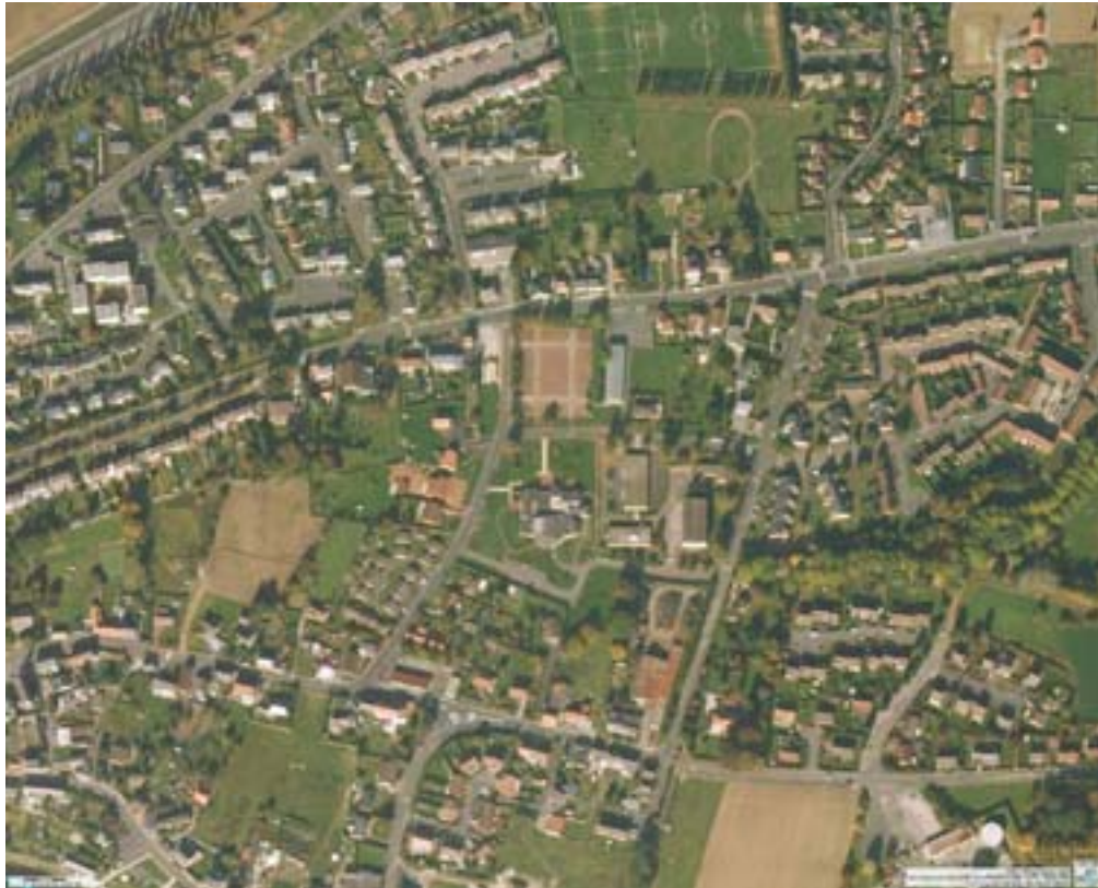
Photographie aérienne d'ensemble avant le projet