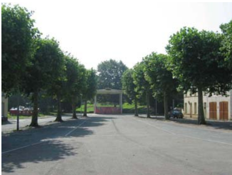
La Place avec le jeu de paume en 2004