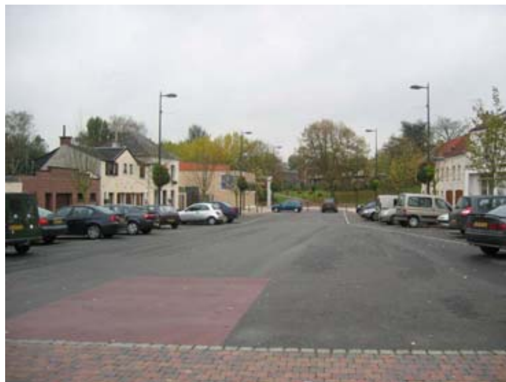
La Place avec le jeu de paume en 2007