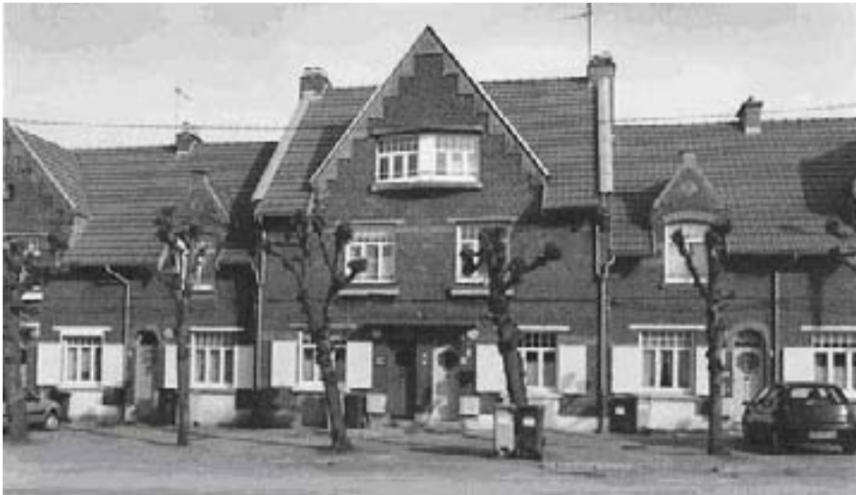
Vue de 2002 (base Mérimée). Tilleuls en tête de chat