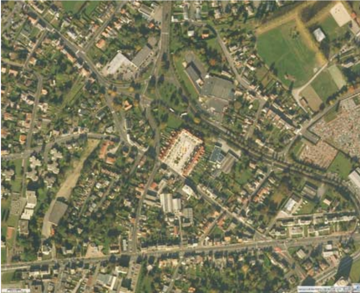
Photographie aérienne d'ensemble après projet