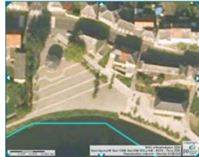
Photographie aérienne (zoom) de la partie ouest