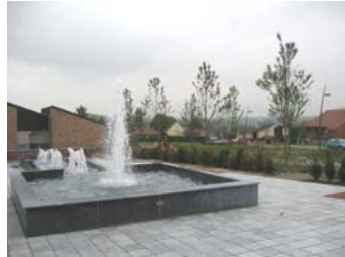
Le parvis de la salle en 2007