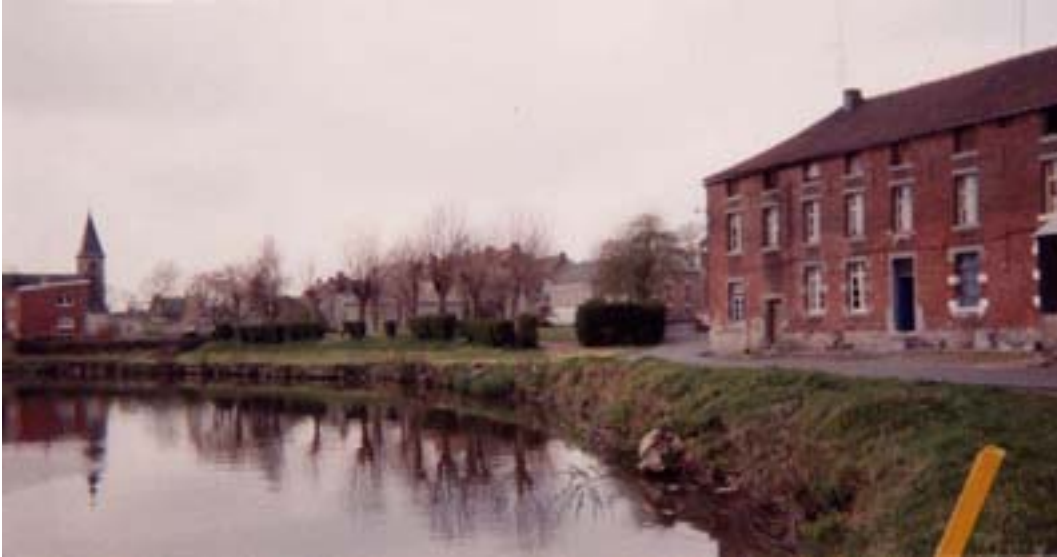
Les espaces publics en 1990