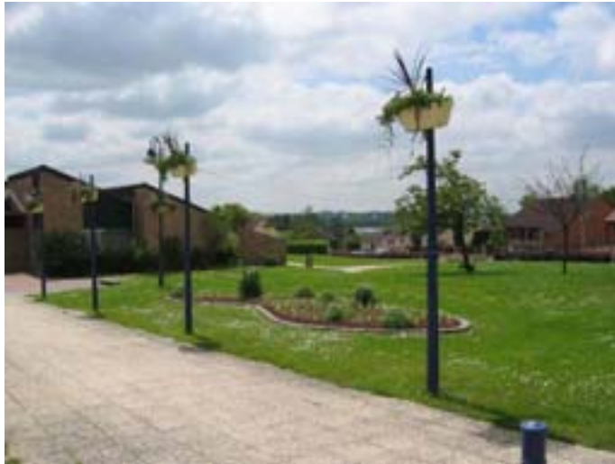
Le parvis de la salle avant travaux en 2006