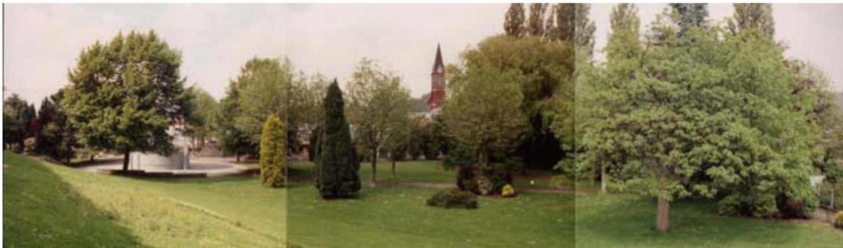
Le jardin en 1991