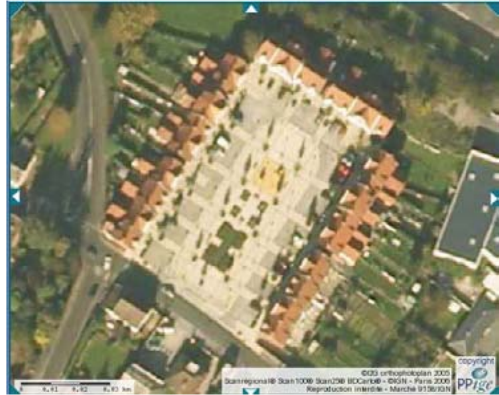
Photographie aérienne de la place (zoom) après projet