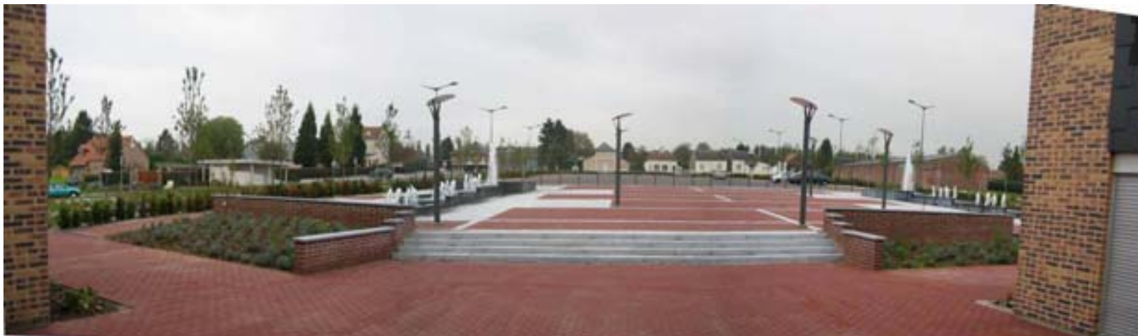
Vue du parvis et de la place depuis la salle en 2007

BEAUrEGaRD –Action 6 - Evaluation des aménagements d'espace public - 2007