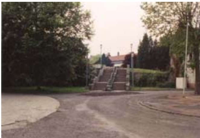
Escalier reliant le square au jardin en 1991