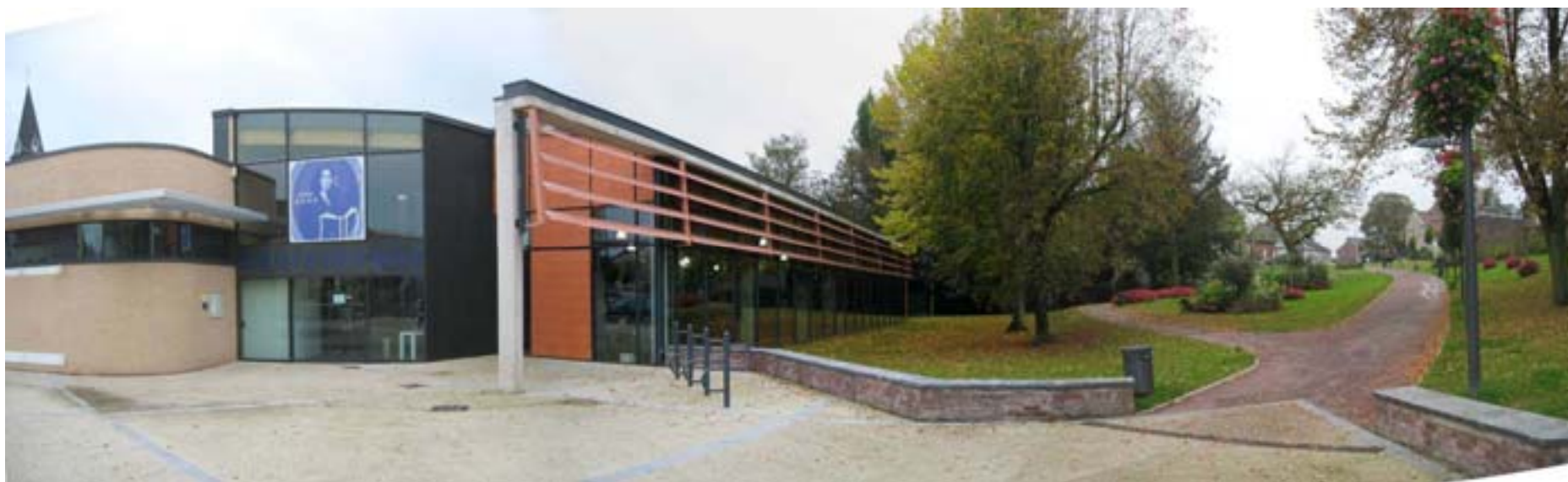
BEAUREGARD – Action 6 - Evaluation des aménagements d'espace public - 2007