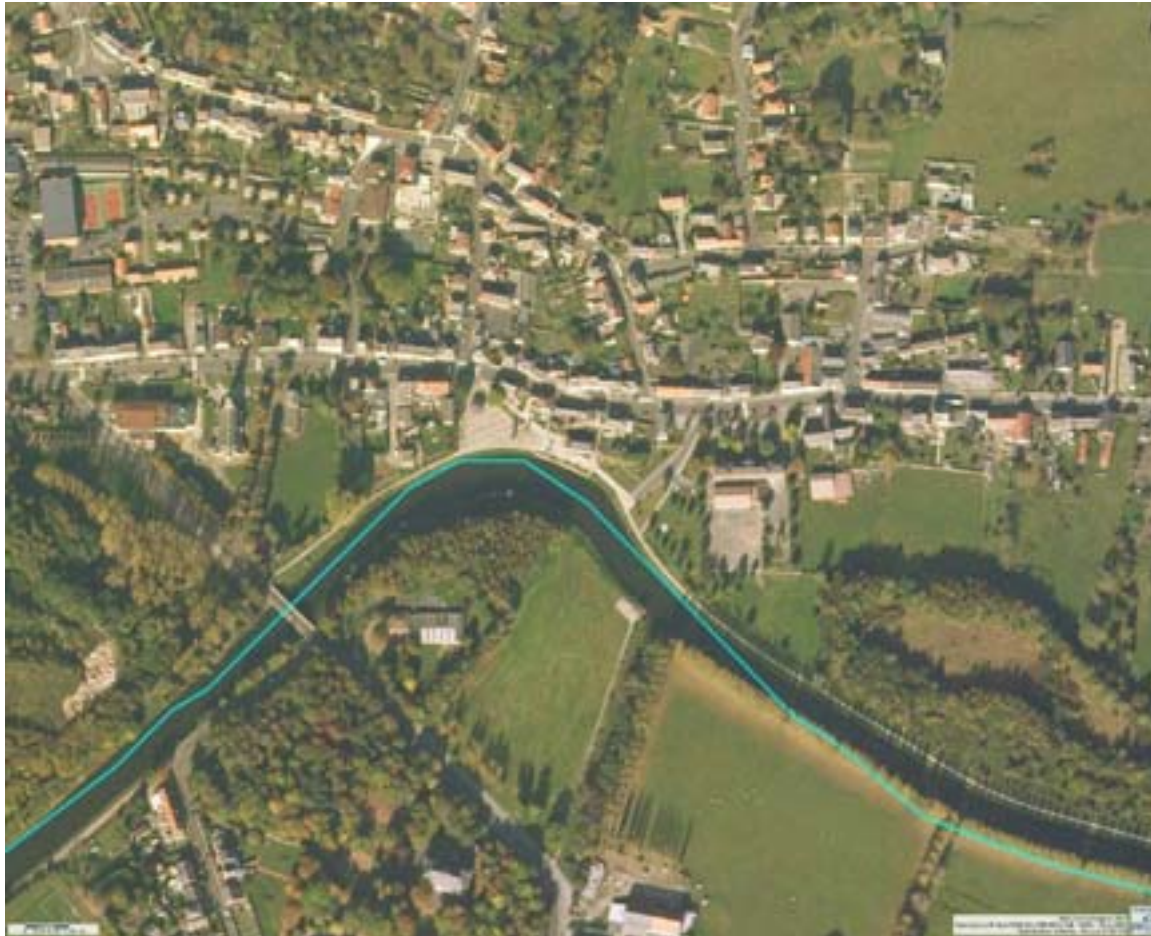
Photographie aérienne d'ensemble après travaux