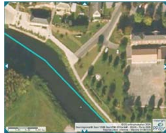
Photographie aérienne (zoom) de la partie est