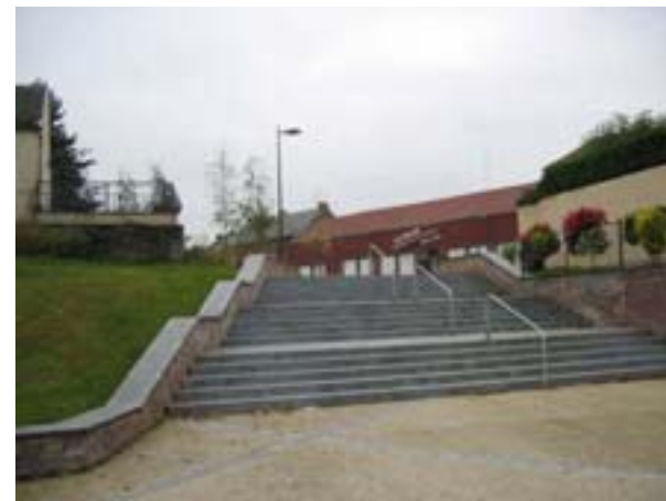
Escalier reliant le square au jardin en 2007