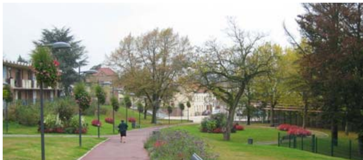
Le jardin en 2007