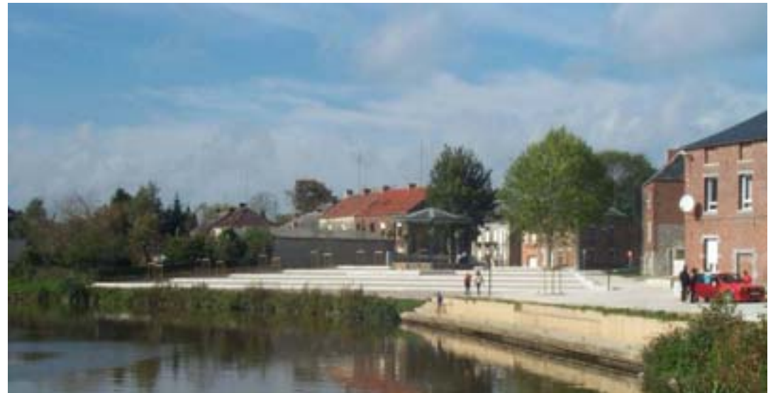
Les espaces publics en 2002 (travaux en cours)

BEAUrEGaRD –Action 6 - Evaluation des aménagements d'espace public - 2007