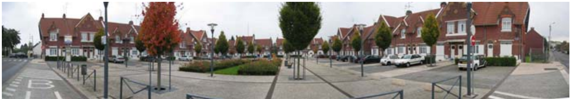
Vue panoramique d'ensemble après travaux en 2007