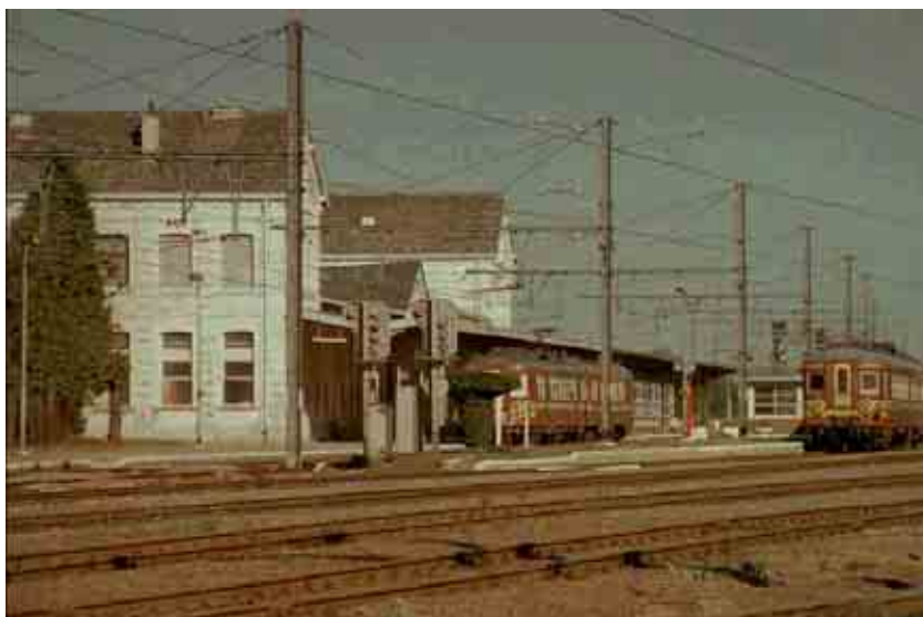
23. Vue arrière de la gare d'Erquelinnes.

Le chemin de fer est un symbole important marquant le début de l'expansion industrielle d'Erquelinnes à partir du milieu du XIXème siècle. Le quartier de la gare et de la frontière devient le nouveau coeur de la localité, se déplaçant vers l'ouest.