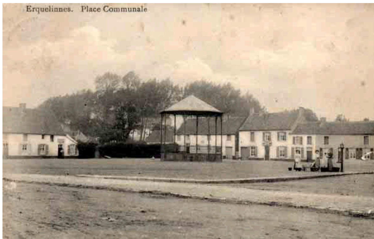
14. La Grand'place vers 1900 (Ancienne carte postale - Coll. Crédit communal).

La carte postale ancienne atteste l'existence autrefois d'un kiosque et d'une fontaine. Celle-ci était alimentée par le ruisseau Sérus qui coulait le long de la rue de Bougnies et qui n'est plus visible aujourd'hui.