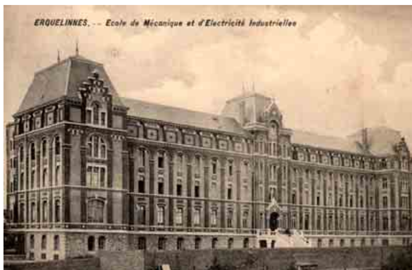
36. Institut des Arts et Métiers avant 1912. (Ancienne carte postale).