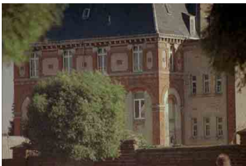
37. Institut des Arts et Métiers depuis la rue Léopold III.

L'Institut des Arts et Métiers (autrefois Ecole de Mécanique et d'Electricité industrielles) s'inscrit aussi dans le contexte du développement économique d'Erquelinnes au début du XXème siècle et la volonté de former une main-d'oeuvre qualifiée pour l'industrie. Fondé en 1910 par les Frères de Reims, il assurait la formation d'ingénieurs techniciens (fonderie, constructions métalliques). D'une taille impressionnante, le bâtiment possède une architecture prestigieuse et représente donc un symbole important sur le plan historico-social, et en tant que centre de rayonnement de l'enseignement (aujourd'hui, promotion sociale).