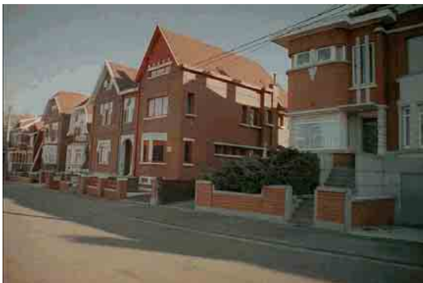
44. Ensemble bâti années 30-50, rue de Maubeuge.

L'expansion industrielle d'Erquennes se poursuit au début du XX ème siècle, entraînant de fortes poussées démographiques et le développement de nouveaux quartiers résidentiels. La prospérité économique donne naissance à une classe bourgeoise. Les fronts bâtis de l'entre-deux-guerres sont caractérisés par la présence de maisons unifamiliales plus cossues, ressortant de la typologie des villas avec jardinets à l'avant.