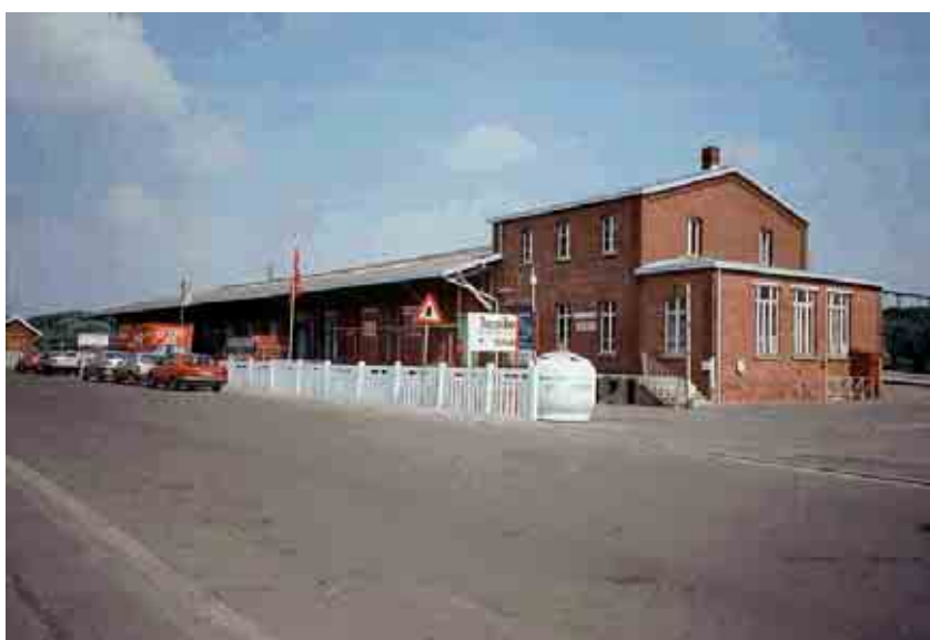
24. Entrepôt place de la Gare.

Le chemin de fer est un symbole important marquant le début de l'expansion industrielle d'Erquelinnes à partir du milieu du XIXème siècle. Le quartier de la gare et de la frontière devient le nouveau coeur de la localité, se déplaçant vers l'ouest.