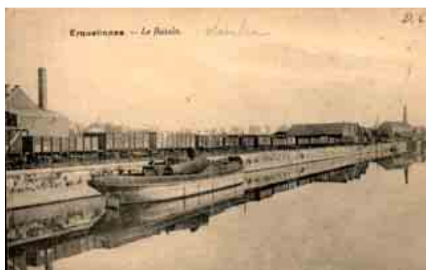
Le bassin vers 1900 (Ancienne carte postale).

La vue ancienne montre le contexte industriel du bassin au début du XXème siècle (présence d'entrepôts, de wagons et de cheminées d'usines) et son importance sur le plan historique et économique. Aujourd'hui, le cadre est essentiellement bucolique.