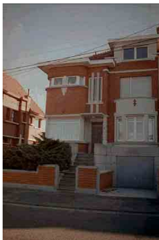
45. Rue de Maubeuge n° 97.

L'expansion industrielle d'Erquennes se poursuit au début du XX ème siècle, entraînant de fortes poussées démographiques et le développement de nouveaux quartiers résidentiels. La prospérité économique donne naissance à une classe bourgeoise. Les fronts bâtis de l'entre-deux-guerres sont caractérisés par la présence de maisons unifamiliales plus cossues, ressortant de la typologie des villas avec jardinets à l'avant.