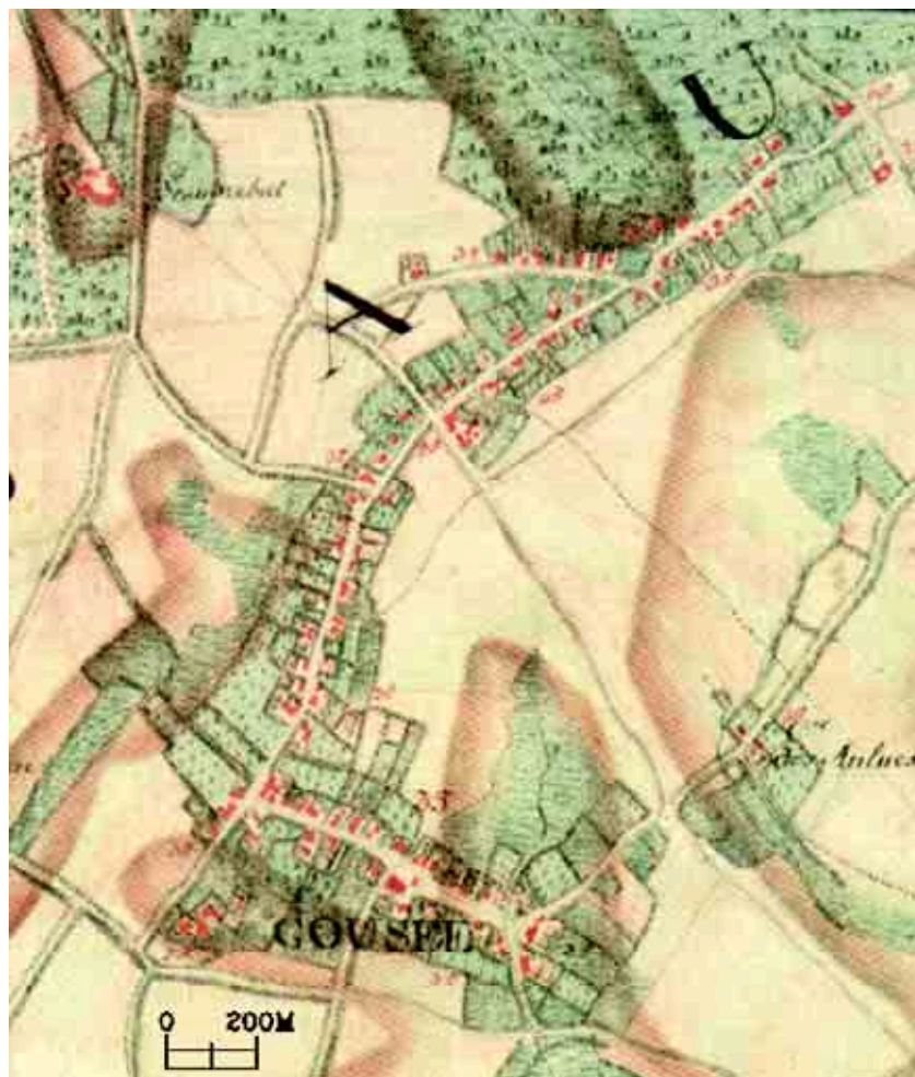
Carte Ferraris