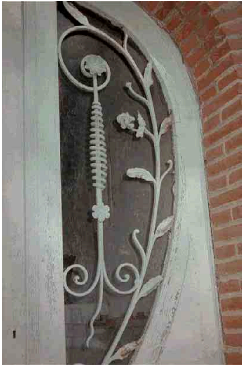
24. Détail des fers forgés de la porte de la chapelle devant le n° 6 rue de Marbaix.

Autre métier artisanal mis ici en exergue, celui du forgeron qui a orné avec dextérité cette grille de porte de volutes et de feuillages. Les métiers d'art d'autrefois - ébéniste, forgeron, stucateur, ... - constituent aussi une part importante de notre patrimoine, celui des savoir-faire, se transmettant de génération en génération.