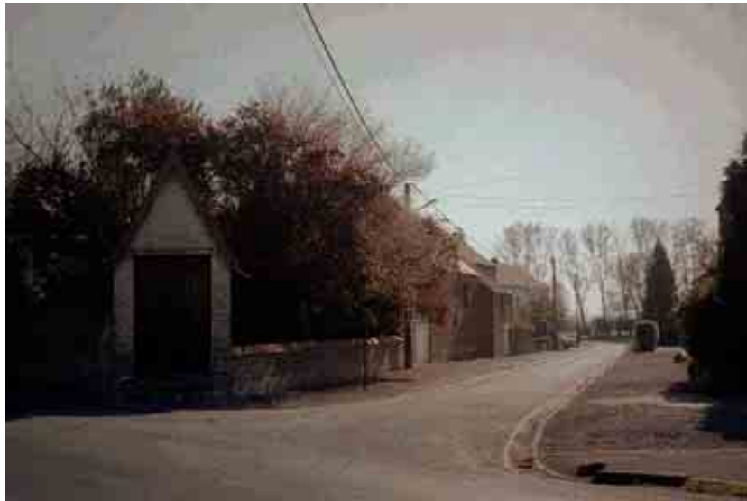
19. Angle des rues de Marbaix et Jacquot. Exemple de percée paysagère intéressante depuis la rue de Marbaix.

Cette diversité paysagère n'est que peu perçue par l'automobiliste qui roule trop rapidement sur cette ligne droite pourtant encore située en agglomération. Le potentiel est présent, il pourrait être mieux mis en valeur et ainsi servir à une approche spontanément plus lente du centre.