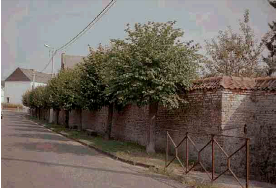
19. Rue Coq d'Aousse : allée de tilleuls, mur, rambarde et banquettes en pierre.

Le côté est de la rue Coq d'Aousse présente un aménagement qui, pour être sobre, n'en est pas moins intéressant.