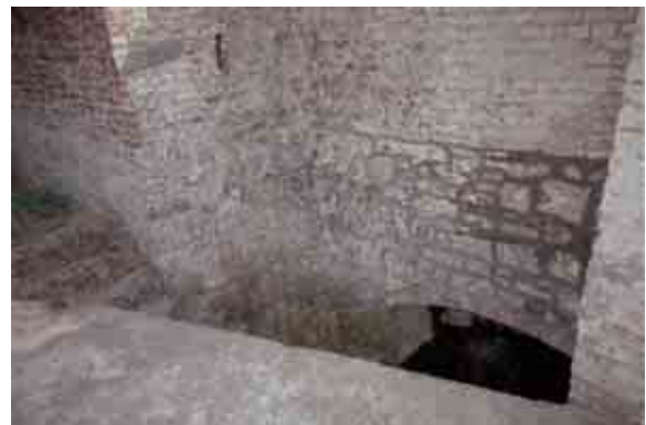
Aménagement du ruisseau en contrebas de la rue Coq d'Aousse.

Le côté est de la rue Coq d'Aousse présente un aménagement qui, pour être sobre, n'en est pas moins intéressant.