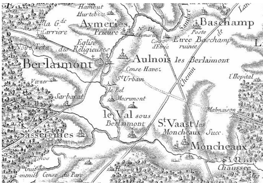
Extrait de la carte de Cassini

Dépendance de l'abbaye de Maroilles, Leval est le siège d'une seigneurie tenue par la famille Leboucq, dont le château fort est déjà en ruine au XVI e siècle.