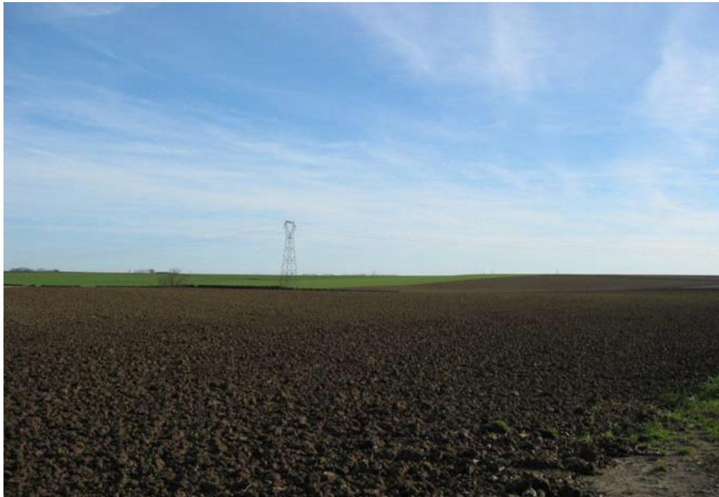
Paysages de champs ouverts entre Fontaine et Hautmont.