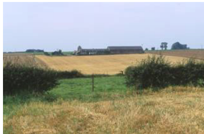
Ondulation du plateau Ferme de Forest.