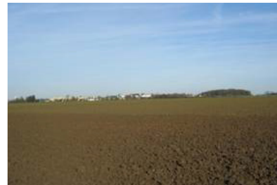
Silhouette urbaine d'Hautmont et du Fort.