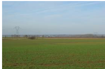
vu du plateau vers l'ouest avec, au-delà de la vallée de la Sambre, l'horizon boisé (Mormal).