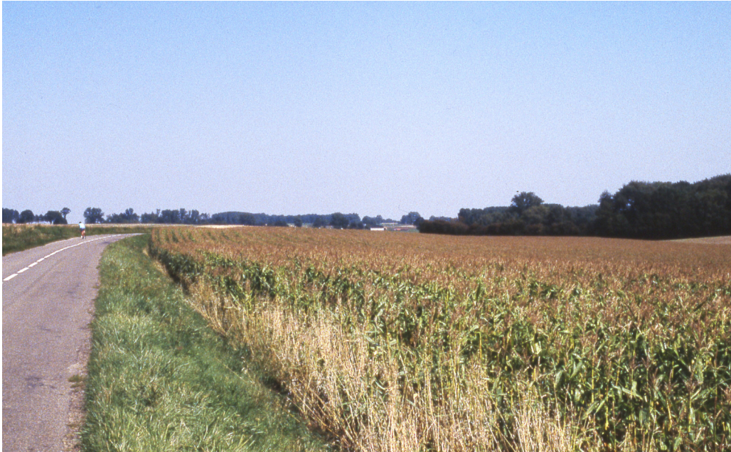
Depuis RD 136-Vue vers le Bois des Sarts