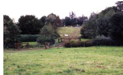
Prairie pâturée proche du centre - ville.