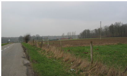
Horizon boisé du bois de la Haute Lanière RD 105-Ferme du Bois l'Abbesse.