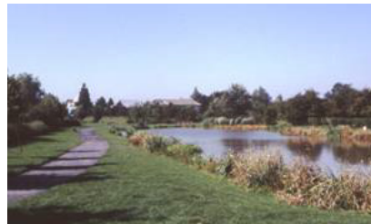
Centre de Feignies, coulée verte le long de la Flamenne.