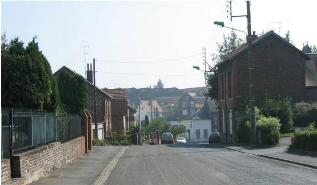
Étalement urbain sur les modulations du relief (Louvroil).