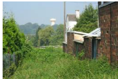
Vue vers le bois du Tilleul à Maubeuge (Sous-le-Bois), depuis l'autre rive de la Sambre.