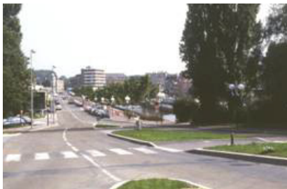
Le Mail de Sambre à Maubeuge.