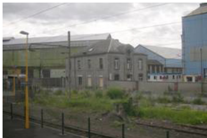
Louvroil, secteur industriel entre la Sambre et la voie ferrée.