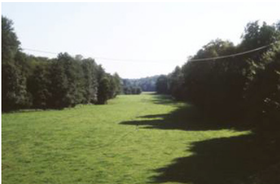
Le fond plat de la vallée de la Solre à la Foulerie (Solrinnes).

L'ambiance générale est fortement dominée par la ruralité qu'aucune grande infrastructure ne vient perturber.