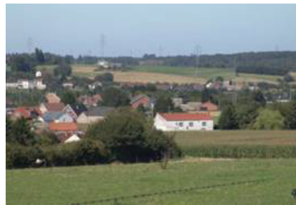
Limite du Bois de Goutroux