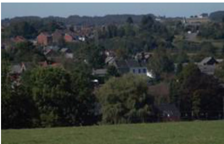
Fontaine-l'Évêque et, au loin, la ferme-château de la Marche