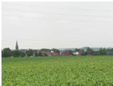
Forchies la Marche