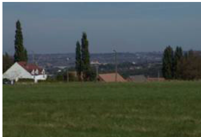
Vue sur la vallée industrialisée de la Sambre