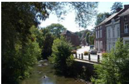
L'Eau d'Heure à Ham-sur-Heure