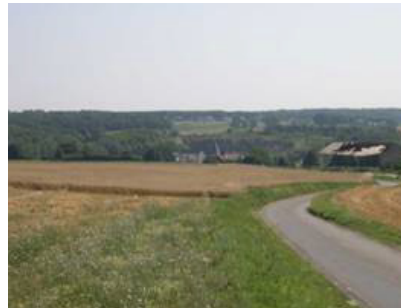
Carrière dans la vallée de l'Eau d'Heure