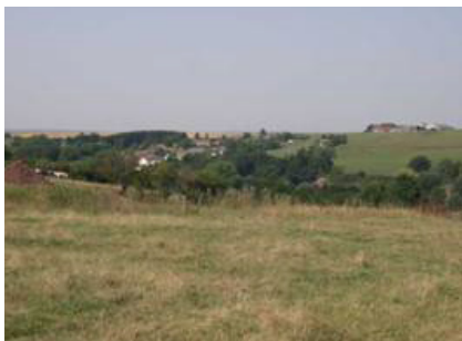
Cour-sur-Heure et le plateau de la Thudinie

Au niveau de l'urbanisation, Cour-sur-Heure est un exemple de village historiquement situé en bas de versant. Thy-le-Château illustre un développement de l'urbanisation dans les vallées, avec l'émergence de petites activités industrielles (carrières, moulins...) en milieu rural, et la création du chemin de fer. Sur la bordure est de l'unité, les extensions résidentielles linéaires plus récentes des villages sont influencées par la proximité de la voie rapide (N5) en direction de Charleroi.