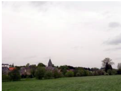
Fond de vallée arboré à Cour-sur-Heure