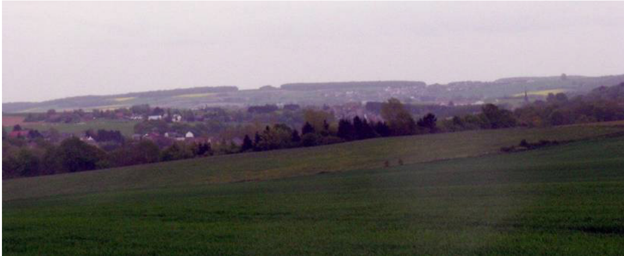
Bombement de la vallée du Thyria et horizon boisé de la Fagne